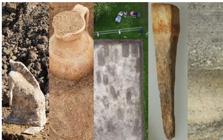
Die Bilder zeigen (von links) die Steinplastik eines Greifs oder einer Sphinx, Keramikbeigaben, das Reihengräberfeld in Langengeisling im Senkrechtluftbild, einen Geweihstift für Sattelbogenbefestigung und eine Keramikscherbe.

legte Reihengräberfeld aus Langengeisling, die vor einigen Jahren entdeckte merowingerzeitliche Grabgruppe aus dem Baugebiet Poststadl sowie eine erst vor wenigen Wochen am Rennfeldweg freigelegte spätantike Grabgruppe. Höhepunkt der Tagung sind Vorträge zum frühmittelalterlichen Kammergrab mit Sättelbeigaben aus Aufhausen-Bergham, das bereits Ende der 1990er Jahre entdeckt und ausgegraben wurde. Die Stadt Erding unterstützt seit einigen Jahren die archäologische Forschung durch das von Prof. Bernd Päßgen geleitete Forschungsprojekt „Erding im ersten Jahrtausend“ durch entsprechende Drittmittel. Die Teilnahme am Symposium ist kostenlos.