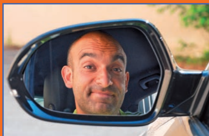
Mi. 27.12.23 20.00 Uhr Django Asül Rückspiegel 2023